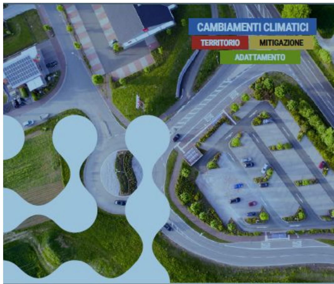
I comuni per l'energia e il clima: le azioni di mitigazione e adattamento

Negli ultimi 2 anni sono state attuate 1.156 misure comportamentali finalizzate alla prevenzione degli eventi meteo estremi , 629.381 i cittadini raggiunti da iniziative e servizi di allerta per eventi meteo estremi, di cui il 10% utenti deboli.